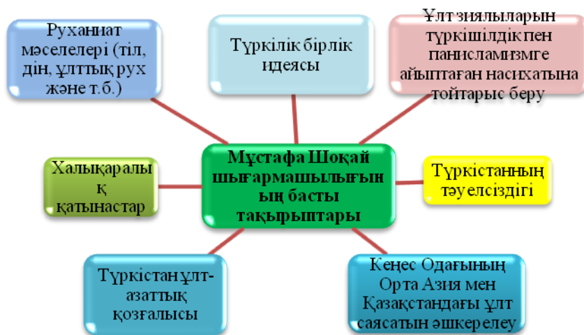
Кесте - Мұстафа Шоқай шығармашылығының басты тақырыптары

Шоқай шығармаларының тақырыптық жүйеленуінің ерекшеліктерін айқындағанда оны тарихилық қағидасы басшылыққа алынды. Кеңестік кезеңде қазақ тарихының мұғажырлық тарихнамасына назар аударылмады. Партиялық-мемлекеттік идеология мұндай әдебиеттердің таралуына қатаң тиым салды. Дегенмен, отандық тарих ғылымының ХХ ғасыр басындағы кезеңі тың теориялық және методологиялық талдауларға негіз болатын оқиғаларға бай. Оған қатысты кезінде айтылып, жазылған ойлар мен көзқарастарға жасалған тарихнамалық зерттеулер кеңестік тарихи ойдың мәні мен мазмұны қандай болғандығын аңғартады. Мәселен, М.Шоқайдың «Тарих жазудың екі жолы бар. Бірінші жолы: зерттеуші өмірде болып өткен оқиғаларды көңіл қойып жинастырады. Оларды хронологиялық тәртібі бойынша заманның жағдайына, ақуалына қарай зерттейді. Мәліметтер мен ақпараттардың бұлақтарын іздейді. Жиналған мәліметтерді өзінің ғылыми зердесінен өткізеді, орнына салады және ол мәліметтерден өзін бейтарап ұстай отырып талдау жүргізеді. Шын мәніндегі ғылыми тарих, міне, осындай тәсілмен жазылады.