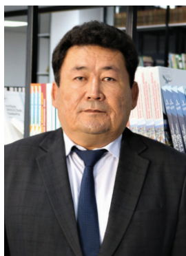
Гуманитарлық-педагогикалық институт директоры, т.ғ.к., доцент

Жалпы, мен Беларусияның Минск қаласында 4 жылдай дәріс беріп келдім. Сонда көзім жеткен шындық, алғыр, зеректік қасиеттер қазақтың қанына сіңген. Сол ерекшеліктерімізді дұрыс пайдалана білгеніміз жөн. Батысқа еліктеп салт-дәстүрден де алшақтап бара жатқан жайымыз бар. Ең бастысы біз «ҚАЗАҚ» екенімізді ұмытпауымыз керек.